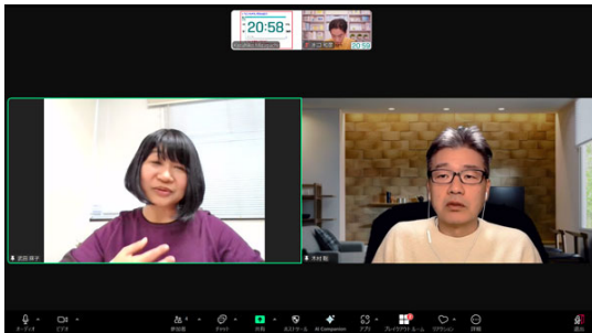
カウンセリング実習中。「ピンを追加」機能を使っています。