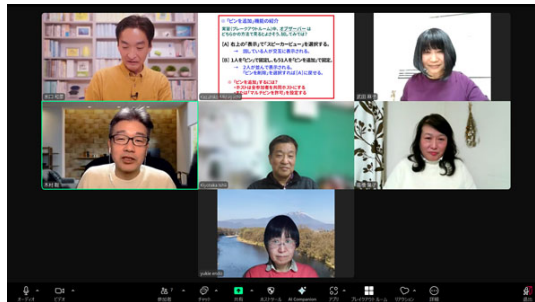
6名参加。全体でのふり返り中です。