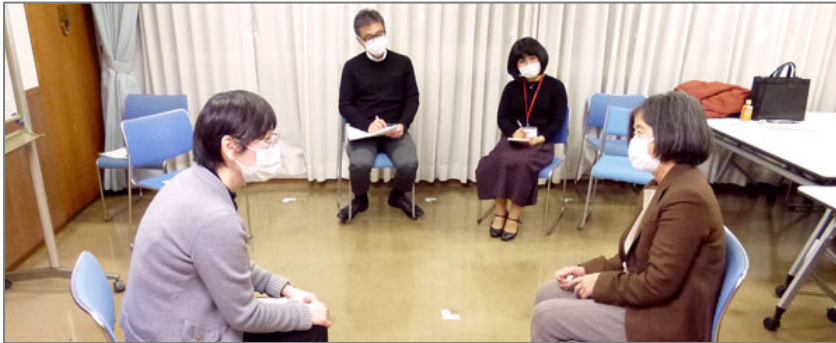
堀留町区民館での実習の様子です。