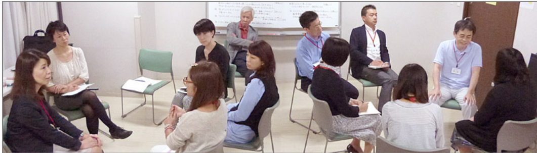
カウンセリング実習タイムスケジュール その4 (25分実習)