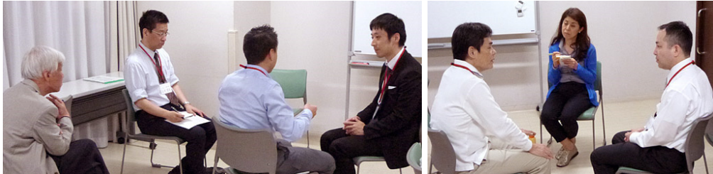
カウンセリング実習タイムスケジュール その4 (25分実習)