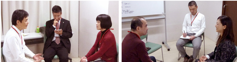
カウンセリング実習タイムスケジュール その4(25分実習)