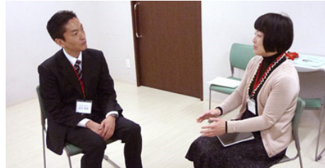
カウンセリング実習タイムスケジュール その4(25分実習)