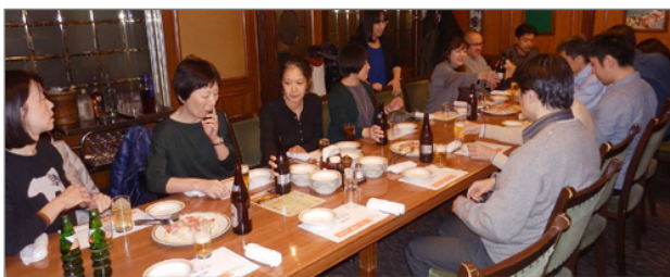
いい雰囲気のお店でした

特別勉強会の後は毎年恒例！NCKの忘年会を行いました！会場は『うすけぼー』日比谷店の個室。いい雰囲気でした。毎年恒例のマジックやビンゴでのプレゼント交換で大盛り上がりでした！