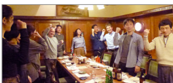
最後は決めポーズ！