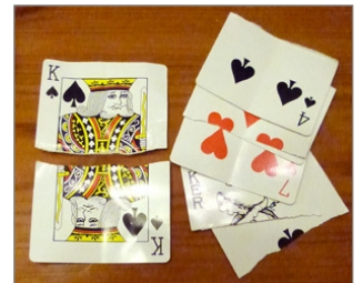
不思議なマジックでした