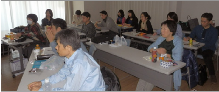
DVDを見ているところです。参加人数が多かったですね！

12/17(土) (13:00~17:00)に『認知行動療法カウンセリング 初級ワークショップ』のDVDを視聴する特別勉強会を行いました！このDVDは合計5時間37分あり、下記の構成になっています。