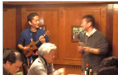
今回のマジックはウクレレ伴奏つきです