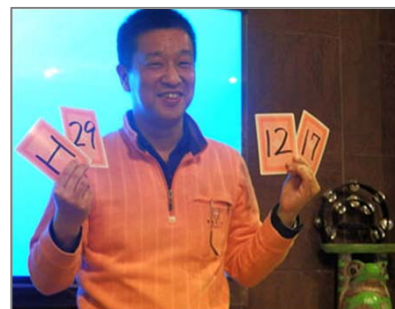
この数字はなんでしょう？