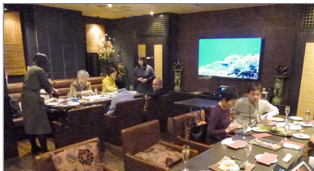
個室でした。確かにリゾートっぽい雰囲気ですね

毎年恒例！NCKの忘年会(兼クリスマスパーティー)を12/17に行いました！ 場所は銀座で、「リゾートダイニング Cascade」というお店です。