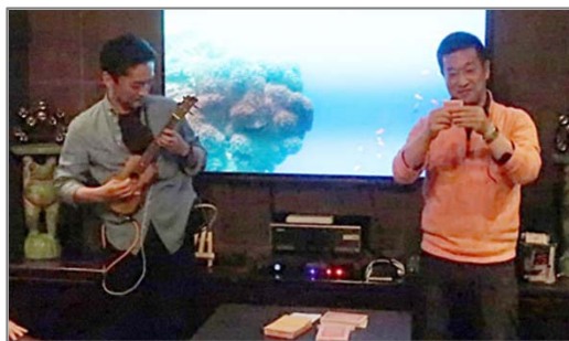
今回のマジックは伴奏つきです