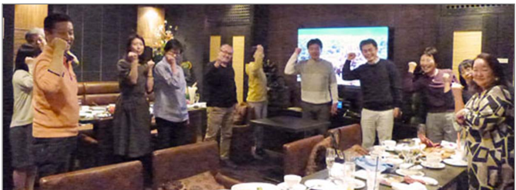
当然「決めポーズ」もやりました！