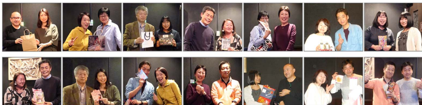
プレゼントをあげた人ともらった人のツーショット。どっちがどっかわかりますか？