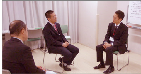
カウンセリング実習タイムスケジュール その4 (25分実習)