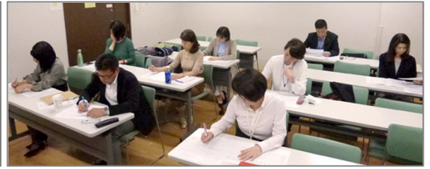
ワークシートに記入しているところです

まず、右記の資料のように「こうなりたい・なっていたい」を考え、次にそれに関わるお金の計画を考えるという流れで進めていきます。