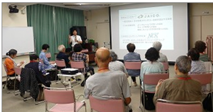
講座(講義部分)の様子です。